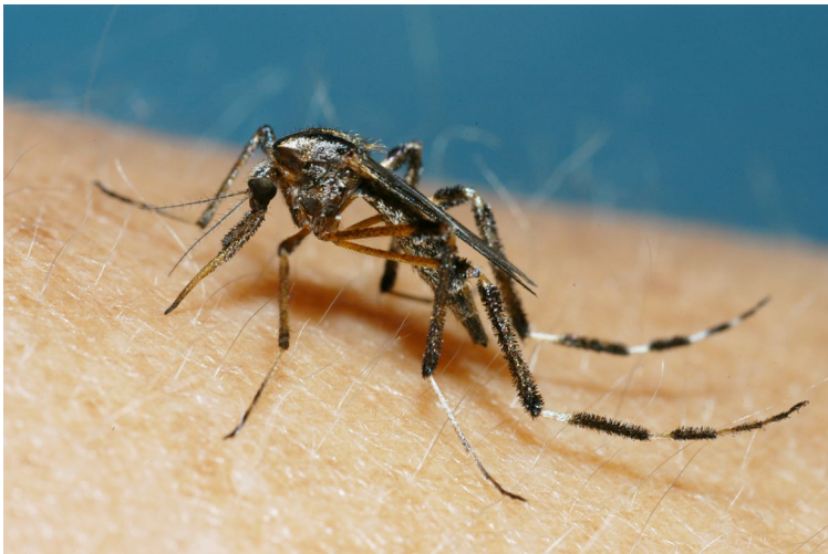
Una hembra adulta del mosquito Psorophora , es un mosquito maligno en Mississippi (Foto cortesía del Dr. Blake Layton, MSU Extension).

Mississippi tiene casi 60 especies de mosquitos, pero solo cinco o seis son plagas de importancia. La mayoría son relativamente raras y están asociadas a un rango de hospedero chico o tienen un nicho ecológico inusual. Por ejemplo, algunas especies se alimentan solo de ranas, por lo tanto las mismas tienen muy poca o casi nada de interacción con los humanos, otras viven en ciertas plantas a lo largo de la Costa del Golfo. La plaga más importante de mosquitos en Mississippi es la que se multiplica en grandes números y es importante por la molestia de la picadura y/la transmisión de la enfermedad.